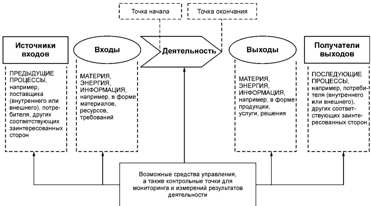
Рисунок 1 — Схематичное изображение элементов процесса

Рисунок 1 дает схематичное изображение любого процесса и иллюстрирует взаимосвязь элементов процесса. Контрольные точки мониторинга и измерения, необходимые для управления, являются специфическими для каждого процесса и будут варьироваться в зависимости от соответствующих рисков.